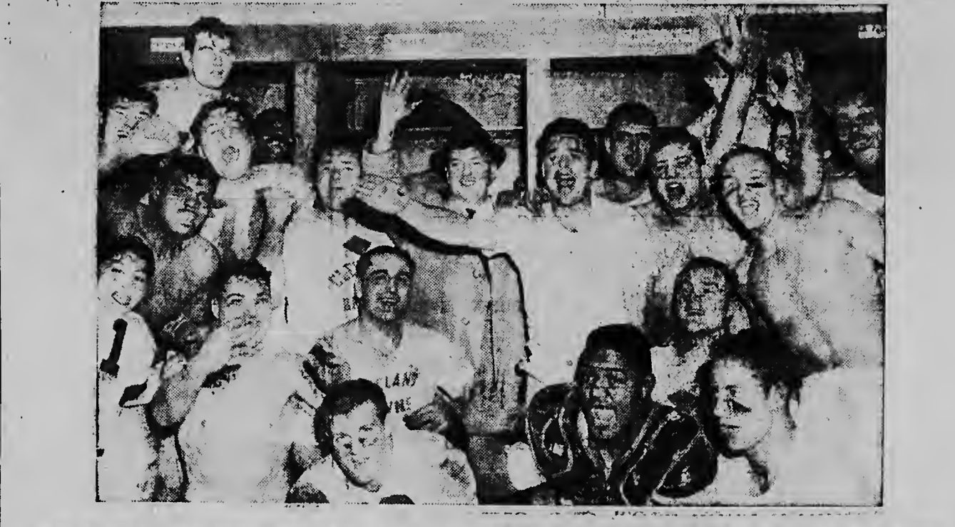
E team di rugby-profesional Americano CLEVELAND BROWNS a logra oor fin di gana campeonato mundial, batiendo Detroit Lions cu 56 pa 10. Coach Paul Brown ta meimel di nan celebrando e ocasion.